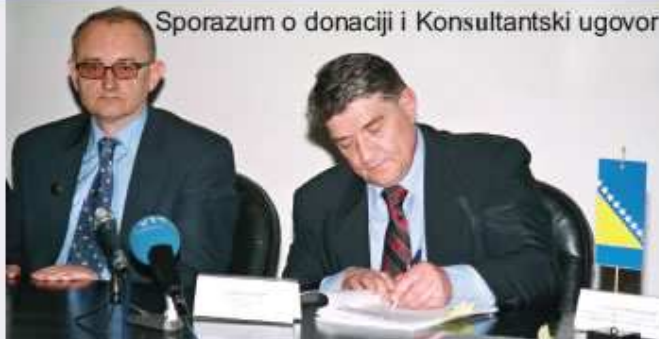
Sporazum o donaciji i Konsultantski ugovor